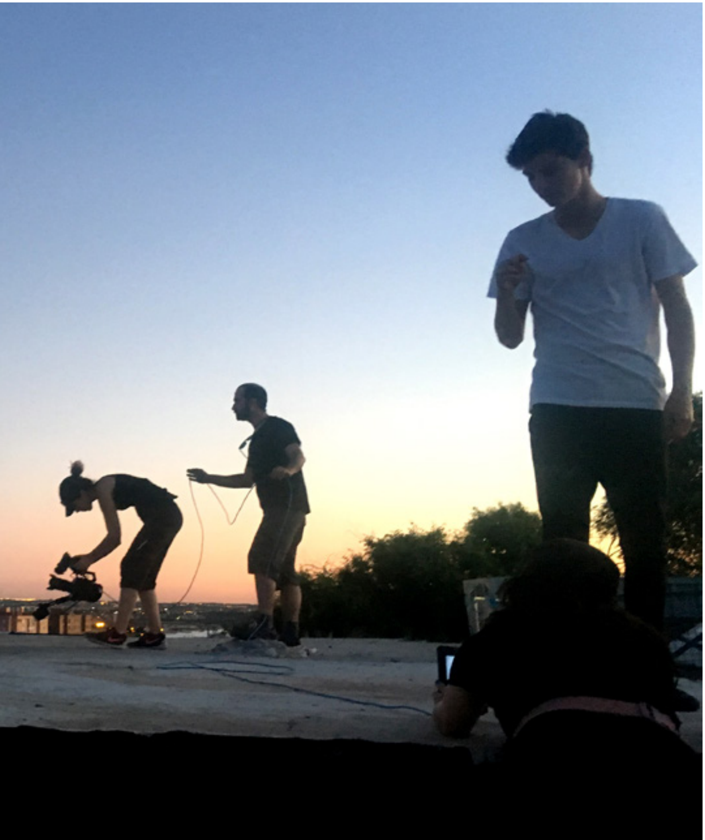
Asociación Proyecto Hombre