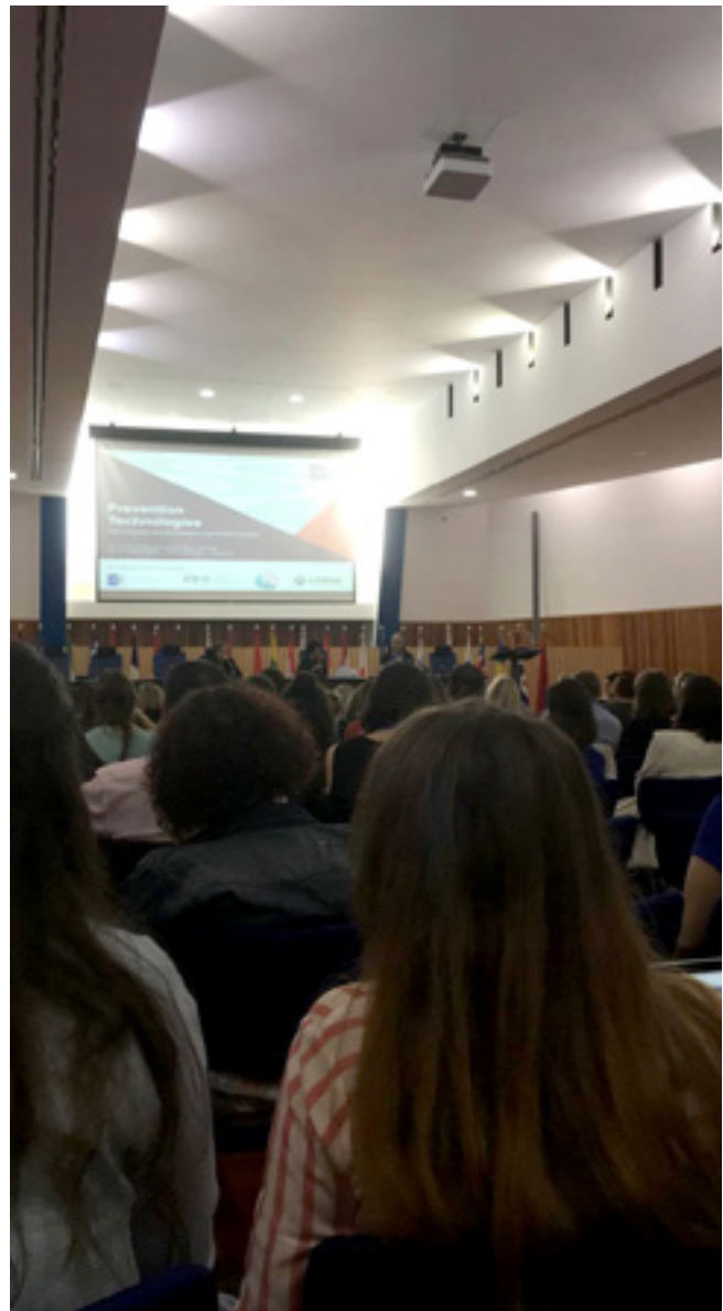
› Conferencia de la Sociedad Europea de Prevención.

La Comisión Nacional de Prevención de la Asociación Proyecto Hombre en España, junto con el equipo de evaluación de la Universidad de Córdoba, diseñó la evaluación del impacto social y emocional del Programa de Prevención escolar y familiar “Juego de Llaves”, bajo el formato de una investigación evaluativa y una interrelación de variables CIPP.