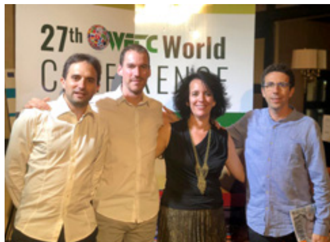
› Equipo de Proyecto Hombre presente en la WFTC

Proyecto Hombre tuvo una participación activa con la presentación del Informe del Observatorio 2017, que fue reconocido como una herramienta de gran valor para conocer a las personas que tratamos y así mejorar los tratamientos. Al mismo tiempo, se expuso el póster del Proyecto INSOLA, donde se resumen los hitos logrados desde 2017 con este proyecto de Inserción Socio Laboral financiado por el Fondo Social Europeo.