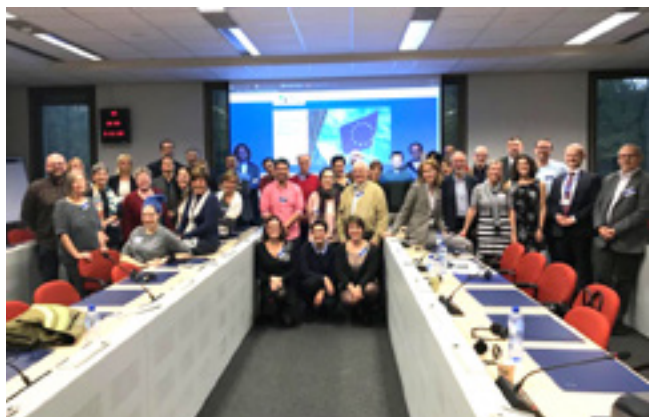
› ONGs en el último plenario del Foro de la Sociedad Civil

La participación de la sociedad civil es una de las piedras angulares de la política europea de drogas, tal como se presenta en el Libro Verde de la Comisión de 26 de junio de 2006 sobre el papel de la sociedad civil en la política de drogas en la Unión Europea. Proyecto Hombre es, desde julio, nuevo miembro del Foro de la Sociedad Civil sobre drogas (CSFD), una plataforma amplia para un diálogo estructurado entre la Comisión y las ONG europeas.